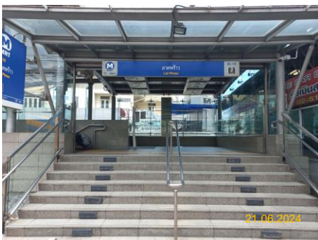
สถานีลาดพร้าว (LAT)