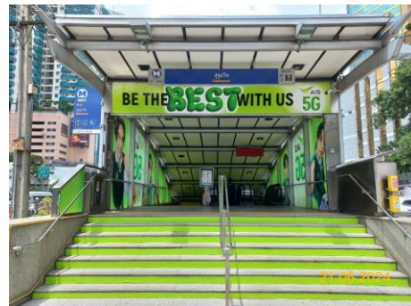
สถานีสุขุมวิท (SUK)

ภาพที่ 1.5-1 (ต่อ) สภาพการดำเนินโครงการในช่วงเดือนมกราคม-มิถุนายน 2567