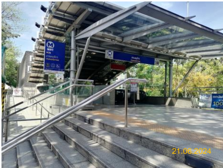
สถานีสวนจตุจักร (CHA)