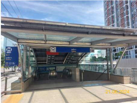
สถานีสุทธิสาร (SUT)