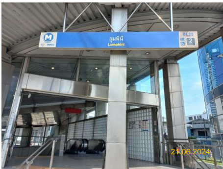
สถานีลุมพินี (LUM)