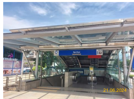
สถานีรัชดาภิเษก (RAT)