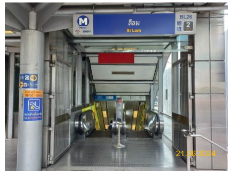
สถานีสีลม (SIL)