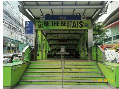
สถานีพระรามเก้า (RAM)