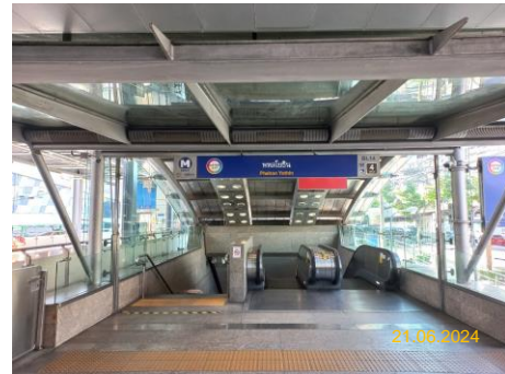
สถานีพหลโยธิน (PHA)