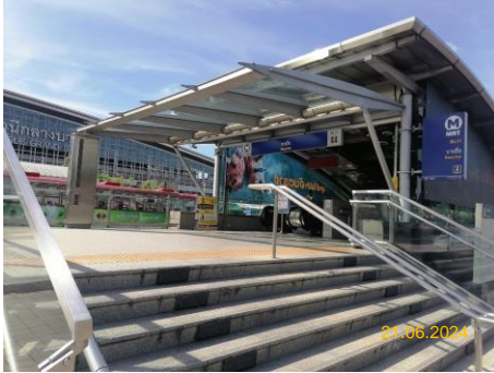
สถานีบางซื่อ (BAN)

บริษัท ทางด่วนและรถไฟฟ้ากรุงเทพ จำกัด (มหาชน) ได้รับสัมปทานสำหรับการลงทุน จัดหาระบบรถไฟฟ้า และการให้บริการเดินรถไฟฟ้า ช่วงสถานีบางซื่อถึงสถานีหัวลำโพง จากการรถไฟฟ้าขนส่งมวลชนแห่งประเทศไทย (รฟม.) โดยเริ่มเปิดให้บริการเดินรถไฟฟ้าเมื่อวันที่ 3 กรกฎาคม 2547 สำหรับการดำเนินโครงการในช่วงเดือน มกราคม-มิถุนายน 2567 มีสถานีรถไฟฟ้าทั้งหมด 18 สถานี และศูนย์ซ่อมบำรุง จำนวน 1 แห่ง แสดงดังภาพที่ 1.5-1