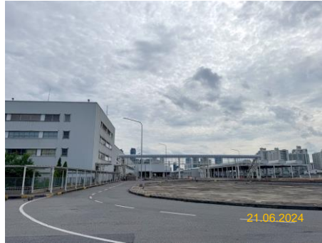
ศูนย์ซ่อมบำรุง

ภาพที่ 1.5-1 (ต่อ) สภาพการดำเนินโครงการในช่วงเดือนมกราคม-มิถุนายน 2567