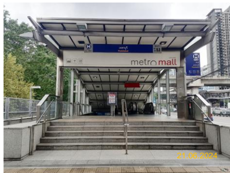
สถานีเพชรบุรี (PET)