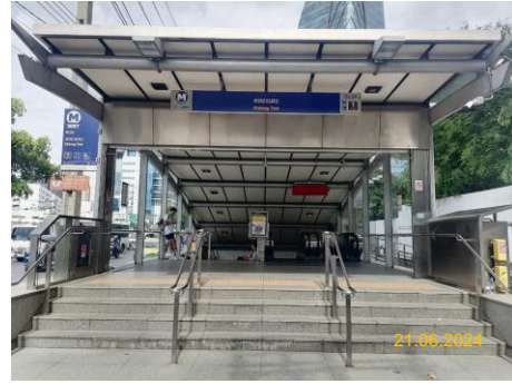
สถานีคลองเตย (KHO)