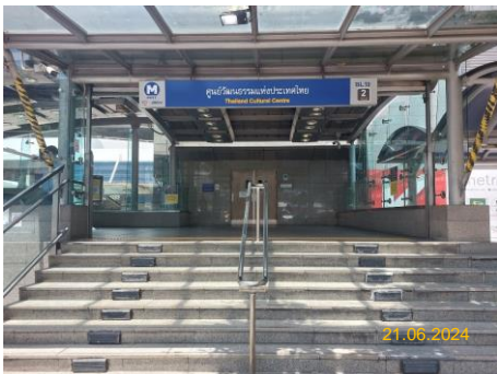
สถานีศูนย์วัฒนธรรมแห่งประเทศไทย (CUL)