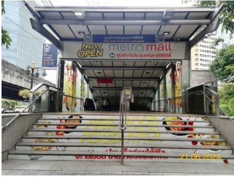
สถานีศูนย์การประชุมแห่งชาติสิริกิติ์ (SIR)