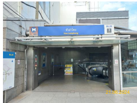
สถานีหัวลำโพง (HUA)

ภาพที่ 1.5-1 (ต่อ) สภาพการดำเนินโครงการในช่วงเดือนมกราคม-มิถุนายน 2567