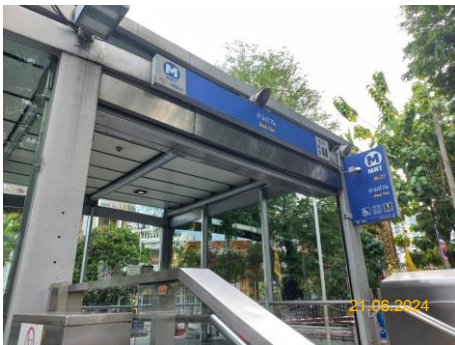
สถานีสามย่าน (SAM)