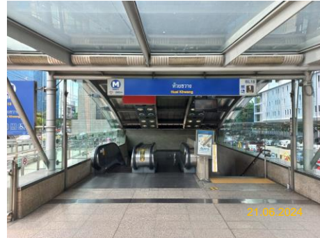
สถานีห้วยขวาง (HUI)