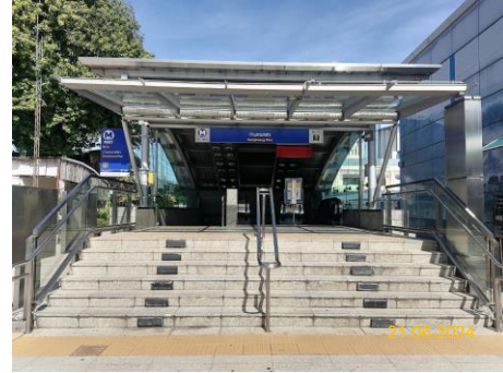
สถานีกำแพงเพชร (KAM)